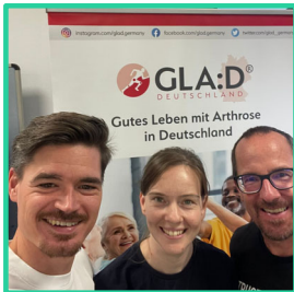
GLA:D Schulung Essen