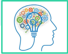
After Work Lecture