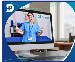
PhysioGO - Praxisgründung leicht gemacht!