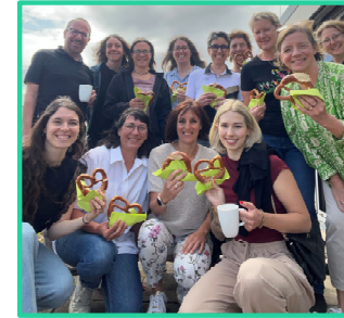
Workshop mit Regionalverband Bayern