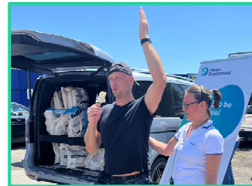
Daimler Care Social Day