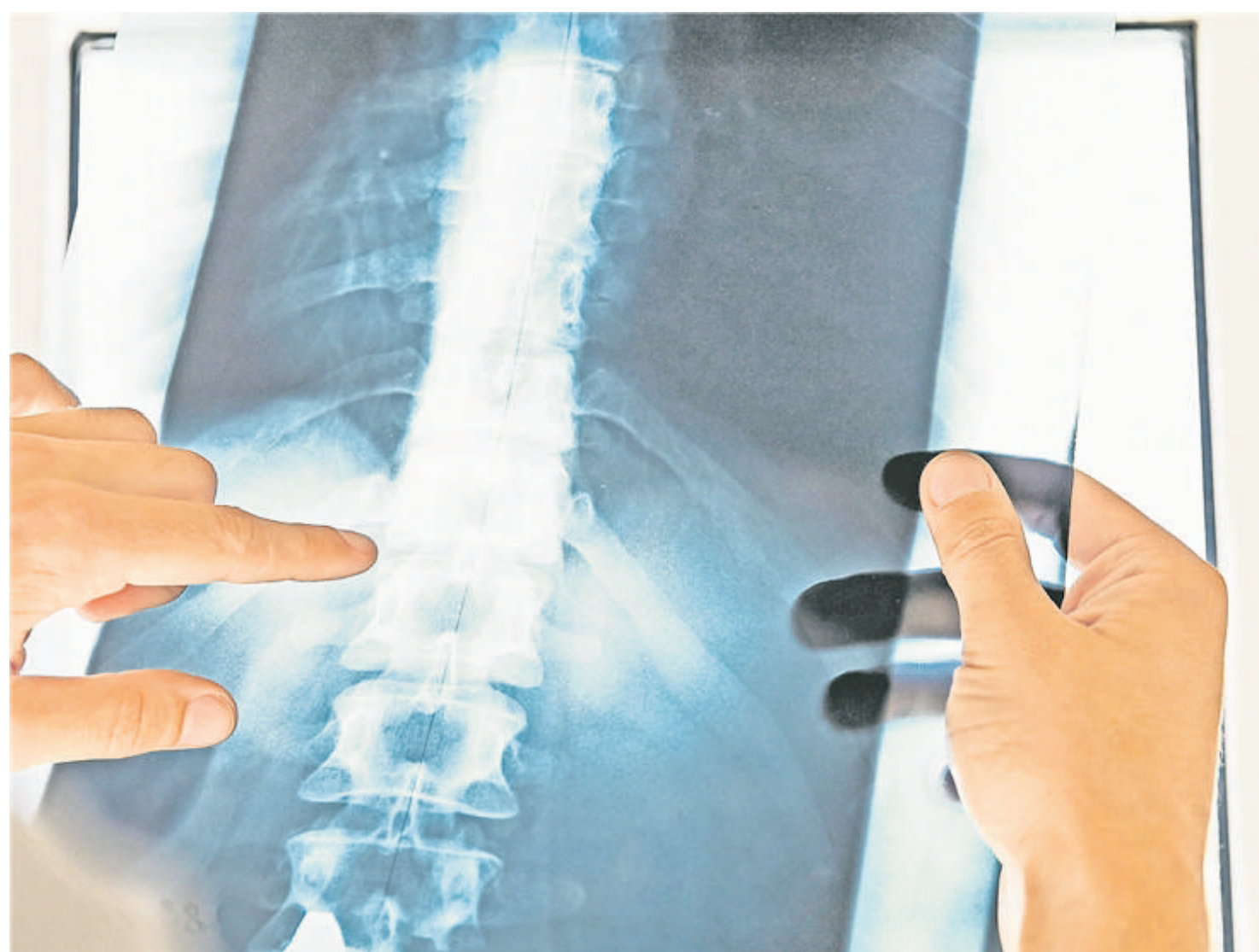
Sich ein Bild machen: Vor einer Rückenoperation macht es immer Sinn, sich eine Zweitmeinung einzuholen.

Besonderheiten: Ganzheitlicher Therapieansatz, Matrix-Rhythmus-Therapie www.hammer-physio.de