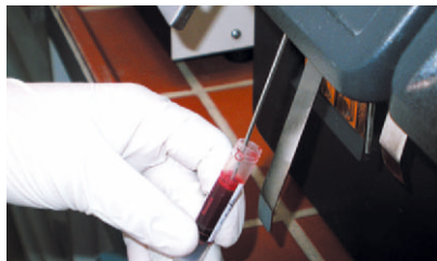
RENAE STEBITZ (2)